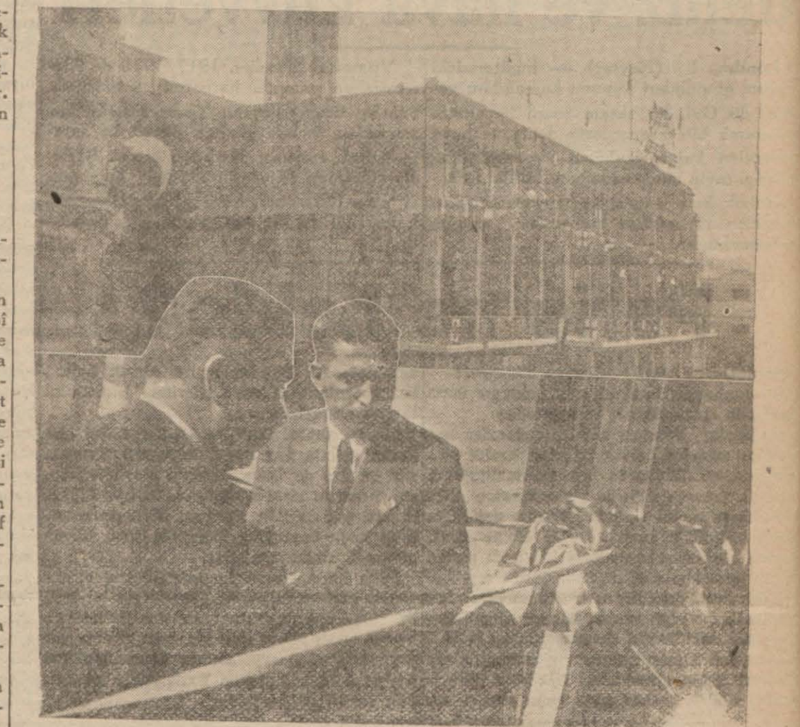
Galatadaki yeni yolcu salonu açılırken

Kabotaj hakkının Türk denizcilerine geçişinin 14 üncü yıldönümü bir deniz bayramı şeklinde ve parlak merasimle dün kutlanmıştır.