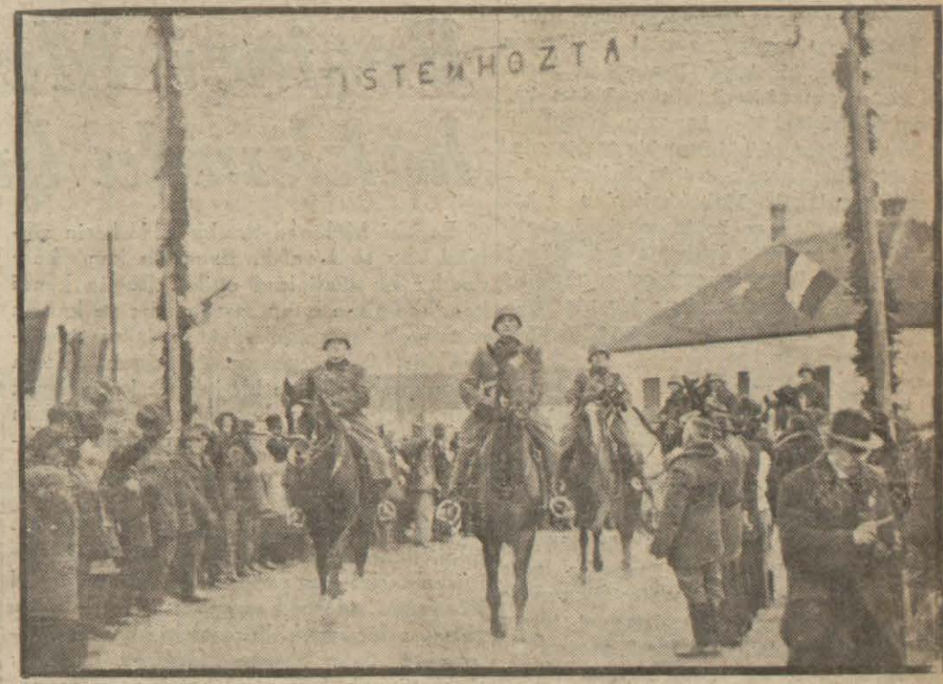
Macar ordusu Rutenyaya girerken

Berlin, 1 (A.A.) — D. N. B. bildiriyor ki, evvelce bildirildiği gibi İngiliz Norman adaları gayri müstakbel hâle getirilmiştir. Şimdi öğrenildiğine göre, o zamandan beri Jersey ile Guernsey adalarına düşman asker ihraçları yapılmıştır. Telefon ve telgraf ile muhabere kesilmiştir. Neuyork, 1 (Hususi) — Alman bombardıman tayyareleri Fransa, Belçika ve Holanda sahillerinde vücutte getirilmiş olan yeni üslerinde mevki almış bulunuyorlar. Büyük miktarda Alman nakliye tayyareleri de, Dunkerke vâsil olmuşlardır. Alman başkumandanlığı tarafından yapılan bütün bu hazırlıkların İngiltereye müteveccih olduğu anlaşılmalıdır. Almanların hazırladığı bu muazzam hava taarruzu, ağılebi ihtimal bir haftaya kadar devam edecektir. Berlindeki salâhiyetler mahfellerine göre, mevcut bütün Alman hava kuvvetlerinin iştirakile yapılacak olan bu taarruz, harbin kat'î neticesini tayin edecektir. Diğer taraftan «Chicago Daily News» gazetesine göre Almanlar, bütün Fransız sahilleri imtidadınca tayyareler için hareket sahası vazifesini görecek şekilde beton-dan bloklar inşa etmişlerdir. (Devamı 3 üncü sayfa)