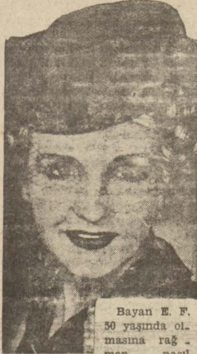
Bayan E. F. 50 yaşında ol- masına rağmen nasıl genç görünü- mü olduğunu anlatıyor:

«Ben 51 yaşındayım; dört defa evlenmiş, kızım ve 3 ufak çocuğum vardır. Buna rağmen ten ve cildimin 30 yaşlarında bir kadınınki gibi taze ve nemli olduğunu söylüyorlar ve bu benim sırrımı öğrenmek istiyorlar. Tatbiki eğitim usul budur.