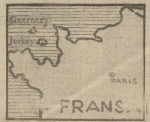
Jersey ve Guernsey adalarının mevkiini gösterir harita

Berlin, 1 (A.A.) — D. N. B. bildiriyor: Alman hava kuvvetlerine mensub cüzütamlar, bir baskın hareketi ile Manşta kâin İngiliz Guernsey adasını işgal etmişlerdir. Bu hareket esasında bir hava muharebesinde bir Alman keşif tayyaresi, Bristol-Blenheim tipinde iki İngiliz muharebe tayyaresini düşürmüştür. Gene Manş denizinde kâin Jersey adası da aynı tarzda alınmıştır. Londra, 1 (A.A.) — Royter Guernsey ve Jersey adalarına Almanların asker ihraçları yapıldığını resmen bildirdi.